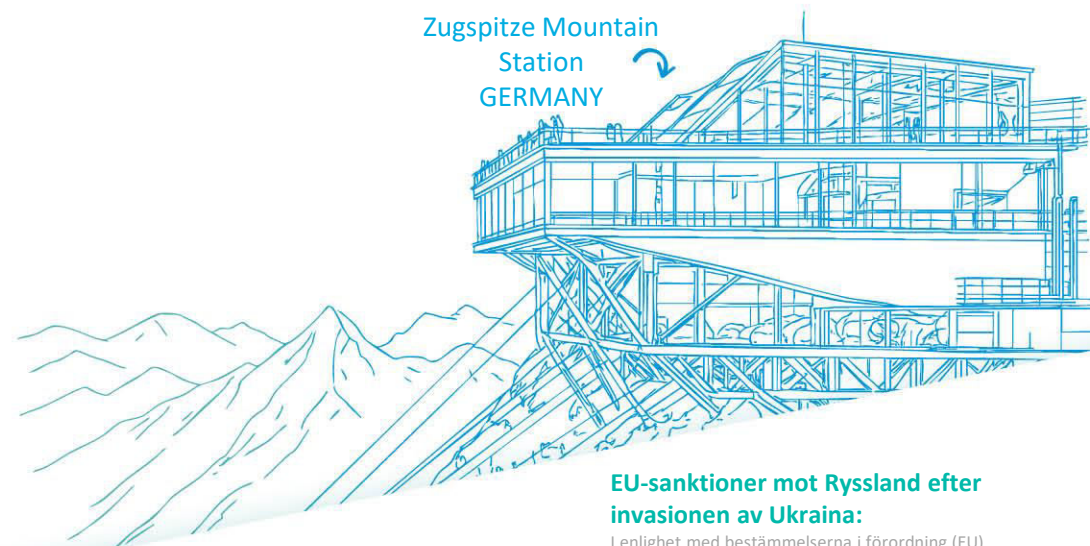
Zugspitze Mountain Station GERMANY