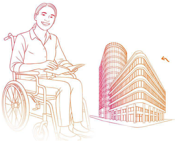
Landesbank Baden- Württemberg GERMANY

Vid en reduktion vill vi betona att endast det reducerade beloppet av din frivilliga insättning kommer att debiteras. För mer information om de specifika reglerna för reduktion, vänligen se https://peg.saint-gobain.com .