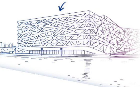
Hangzhou Yuhang Opera CHINA

*Syarat dan ketentuan serta harga saham tersedia dari Pemegang Rekening Anda.