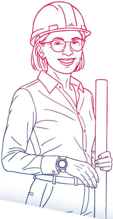
Mohammed VI Tower MOROCCO

Dalam 5 tahun ke depan, aset Anda akan tersedia dan nilai saham Anda akan mencerminkan harga saham pada tanggal tersebut.