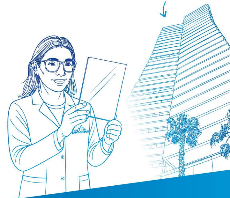
Housing Viviendas Illa del Mar SPAIN

Dana yang secara khusus dibuat untuk menerima investasi dari para pelanggan Penawaran 2026.