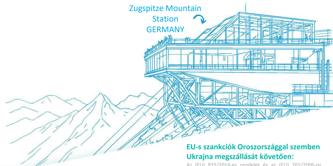
Zugspitze Mountain Station GERMANY