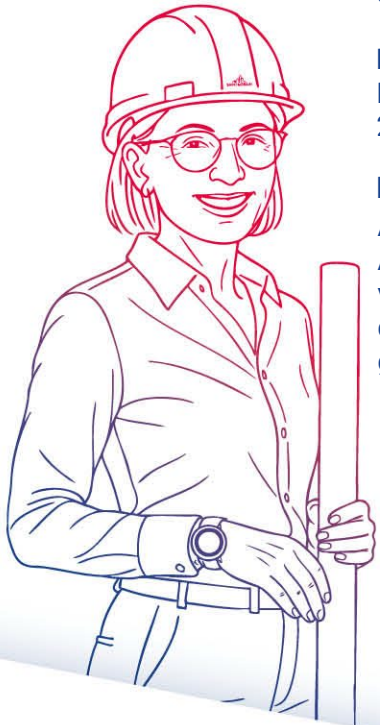
Mohammed VI Turm MAROKKO

Angesichts der Risikokonzentration, die mit der Anlage in Aktien eines einzigen Unternehmens verbunden ist, wird den Zeichnenden empfohlen, die Notwendigkeit einer Risikostreuung ihrer gesamten Finanzanlagen zu prüfen.