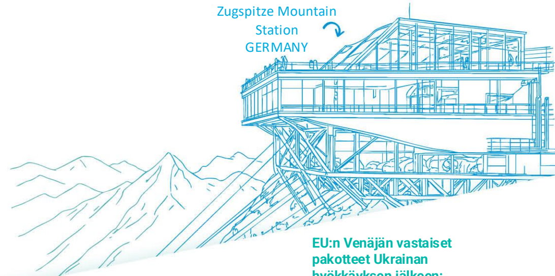
Zugspitze Mountain Station GERMANY