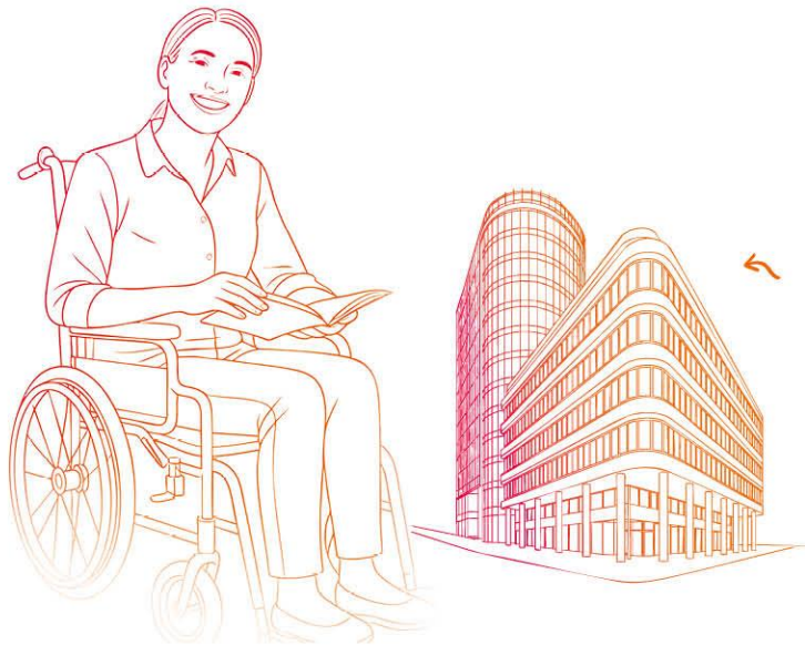
Landesbank Baden- Württemberg GERMANY

Vähennystilanteessa on huomioitavaa, että työntekijöiltä veloitetaan ainoastaan alennettua määrää vastaava summa. Lisää tietoa vähennystä koskevista säännöistä löydät osoitteesta: https://peg.saint-gobain.com .