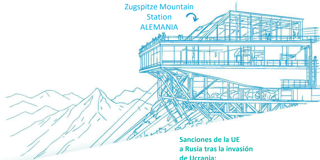
Zugspitze Mountain Station ALEMANIA