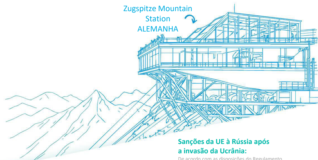
Zugspitze Mountain Station ALEMANHA