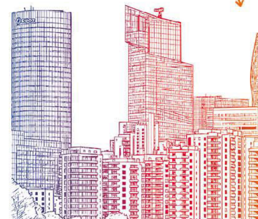
Saint-Gobain Tower FRANÇA

No caso particular em que os volumes de câmbio nos mercados financeiros são pequenos, qualquer transação de compra ou venda pode conduzir a flutuações significativas no mercado. Consulte as regras do Fundo de Participação de Empregados em questão para obter mais informações sobre estes riscos.